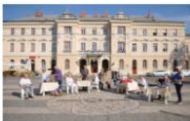
CULTURA E TURISMO