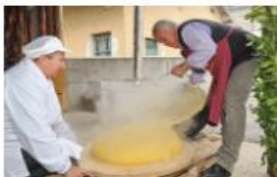
SOSTEGNO PER LA FAMIGLIA