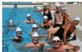
SALUTE E BENESSERE