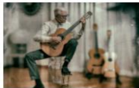
ABITARE E ACCESSIBILITÀ