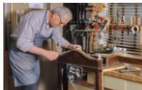
FORMAZIONE E COMPLETAMENTO ATTIVITÀ LAVORATIVA