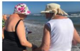
CONTRASTO ALLA SOLITUDINE

L'utente ha facilmente accesso alle sezioni di interesse all'interno delle quali vengono proposte le attività dedicate